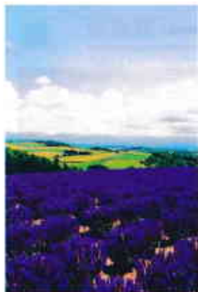
ラベンダーの本場北海道では、7月から8月に見ごろを迎えます。一面のラベンダー畑は絶景ですね。