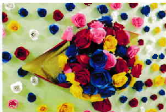
作業活動の時間に、利用者様がバラの花束を作りました。色画用紙を使って立体的に作られたバラが、長い廊下を飾っています。

5月の第2日曜日は「母の日」、6月の第3日曜日は「父の日」。日頃はなかなか伝えられない父母への感謝の気持ちを伝えるよいチャンスですね。日本だけの行事だと思われているかもしれませんが、実は両日ともアメリカ発祥の記念日。今では、全世界で制定され、国や文化によって感謝の表し方は千差万別ようです。コロンビアの母の日は「お母さんは何もしなくていい日」。ドイツの父の日は「男同士が集まって森にピクニックに行き、昼間から飲む日」なんだそうです。どちらも、仕事や家事から離れてゆっくり過ごしてもらいたいというやさしさなのでしょう。この日だけでなく、いつも感謝の気持ちを伝えたいものですね。