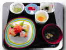
毎の日にスペシャルメニューを召し上がっていただきました。