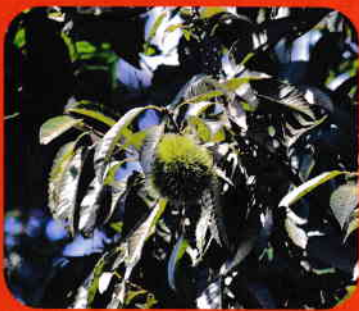
ラパスの栗の木も実り始めました。

秋は9月から11月の3ヶ月間と、とても短いものですが、米・野菜・果物・木の実・山野草の実・きのこなどのさまざまな食材に恵まれます。まさに実りと食欲の季節の到来です。