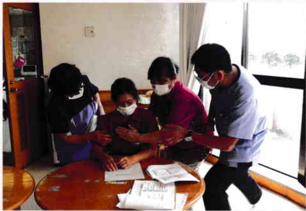
利用者様が食事中に誤嚥した場合の対応をシュミレーションしました。

ラ・パスでは、人材育成と活気に満ちた働きがいのある職場づくりに取り組んでいます。