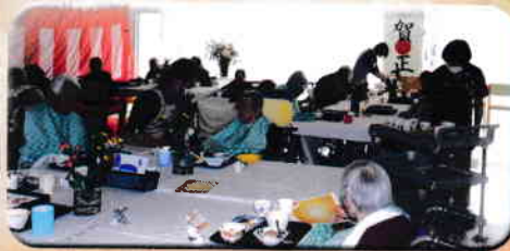
お正月御膳を召し上がっていただきました。