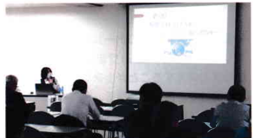
朝倉市人権・同和教育推進協議会の研修会で、「海外人材の受け入れの態勢づくりと課題～共に働く仲間として～」を発表しました。