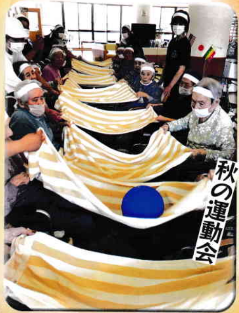
みなさんで力を合わせてボール運び