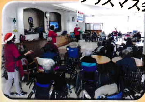
サンタクロースがやってきた!

運動会、クリスマス会、新年祝賀会などのイベントを開催し、入所者様に喜んでいただきました。