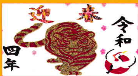
今年も大きな壁画が出来上がりました。