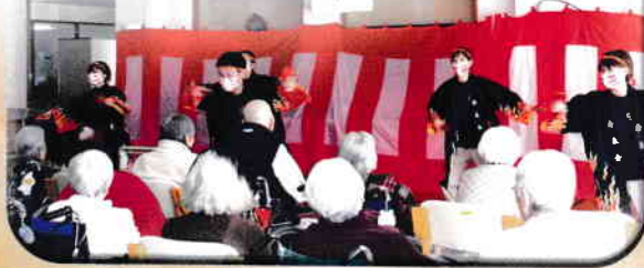
若手職員が黒田節を披露しました。