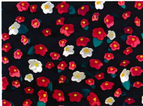
入所様が画用紙を使って立体的に制作した壁画です。