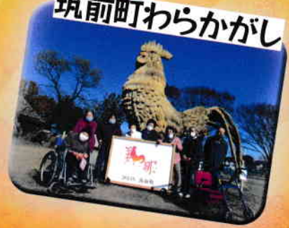
デイケアご利用者様とドライブに出かけました。