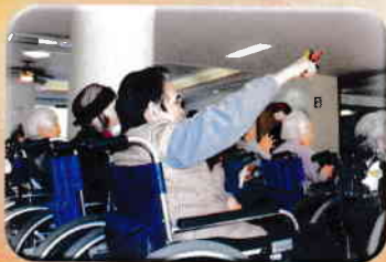
入所者様も手拍子や鳴子を使って参加していただきました。