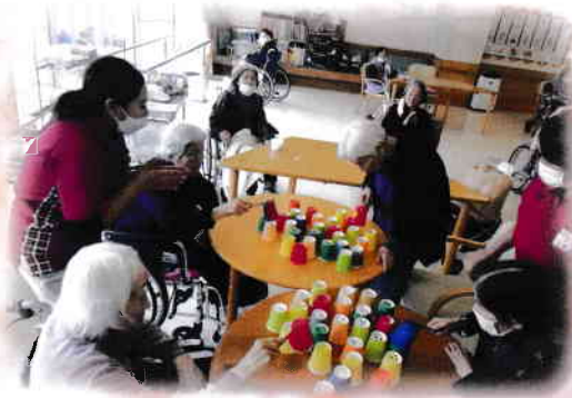
＼ みんなでゲーム ／