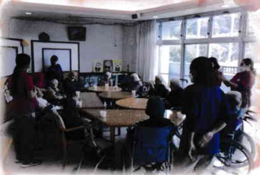
毎月、合同お誕生会を開いています。