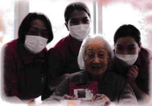
お誕生日おめでとうございます！