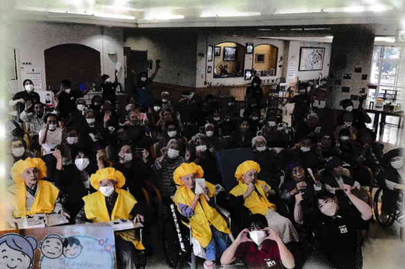
ご長寿お祝い敬老会

9/18に敬老会を実施しました。職員が、お一人おひとりに、長寿のお祝いの言葉を添えたフォトフレームを作成してお渡ししました。式典が終わり、テーブルに置かれたフォトフレームを手に取りメッセージを読まれるお姿はとても微笑ましく、周囲が和みました。これからも、ご利用者様からたくさんの学びをいただきながら、みなさんと一緒に楽しく笑顔で過ごしていきたいと思えます。