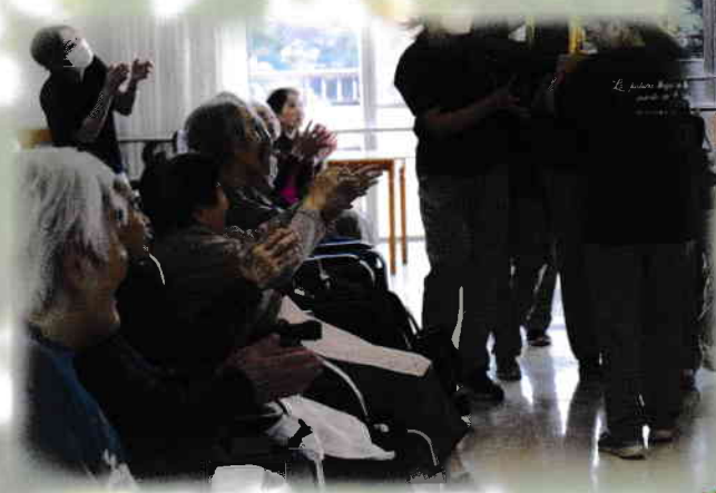
笑顔がいっぱい秋祭り