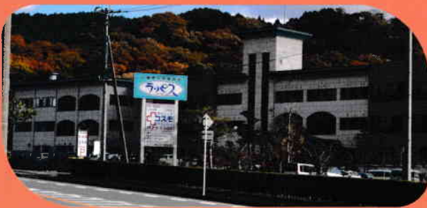
秋も深まってきました。

小春日和のうららかな日が続いている今日この頃。秋風に揺れる濃淡のピンクや白、マーブル模様のコスモスが、気持ちを和らげてくれますね。気候のよい日が多いこの時期に秋の花々や紅葉など季節の絶景が楽しめる名所や、晩秋から始まる人気のイルミネーションスポットなど、地域のあちこちで見つけてみませんか？